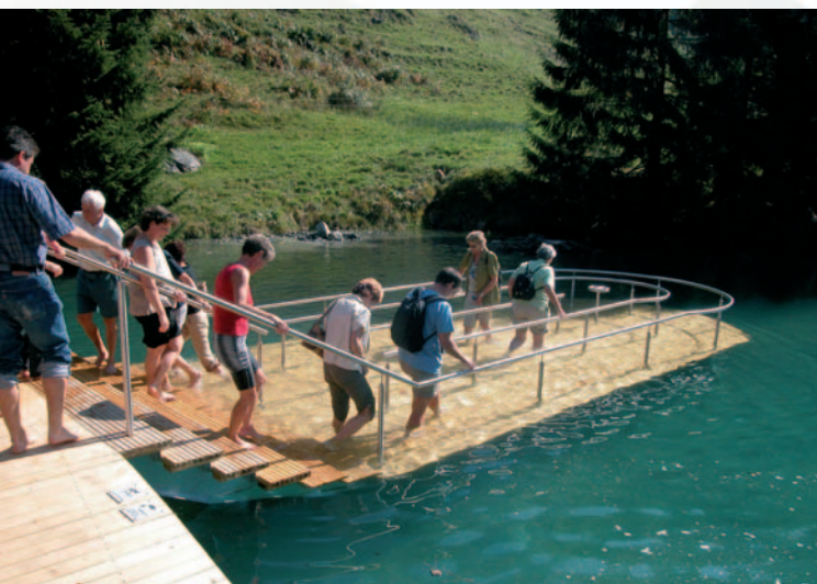
Die Kneippanlage Schwandalpweiher wurde im September 2003 als erstes Modul der Wassererlebniswelt Flühli-Sörenberg eröffnet. The Kneipp facility Schwandalpweiher was opened in September 2003 as first module of the water experience world of Flühli-Sörenberg.

As part of Dynalp the municipality is to develop a master plan to define and co-ordinate the offers, which are to strengthen the municipality's sustainable development and enable a value added in terms of tourism. To utilise the landscape defined and shaped by its water resources to develop tourist offers.