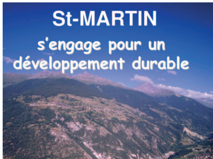
St Martin s'engage pour un développement durable. St Martin is committed to sustainable development.

Durchführung: die Wiederinstandstellung der Infrastruktur auf dem Plateau Ossona/Gréferic zur touristischen Nutzung. Die Attraktivierung des touristischen Angebots führt zu vermehrten Übernachtungen.